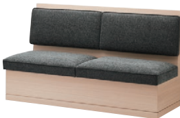
モナカ WNA-1600 張地: Rank-C スムージー UP5745 — P.269 ¥297,000