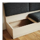
■オプション: 下部収納タイプ (別途見積り)