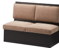
モナカ BR-1200 張地: Rank-D モナ BE — P.270 ¥272,000