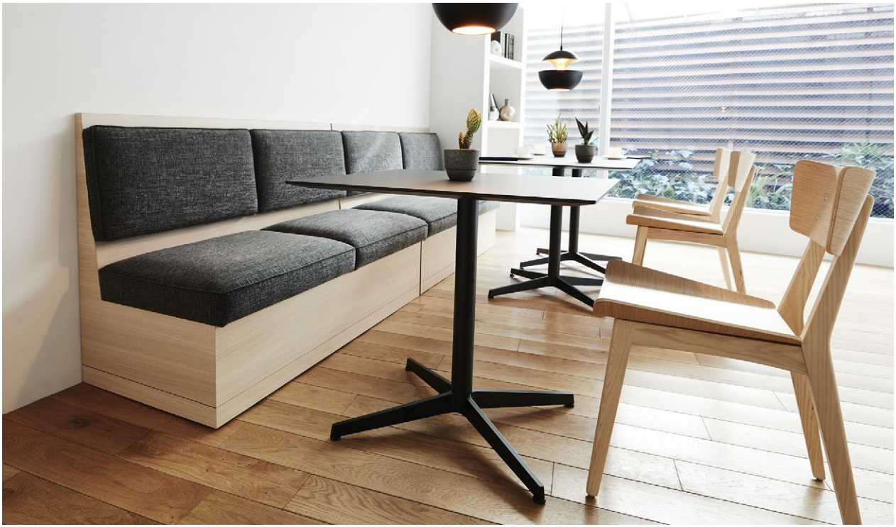
Table: NTMR II 75-BL — P.240 | Chair: 参考商品