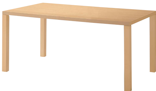
KT-720 (BR) 天板：突板/ブナ柾目 面材：突板/ブナ