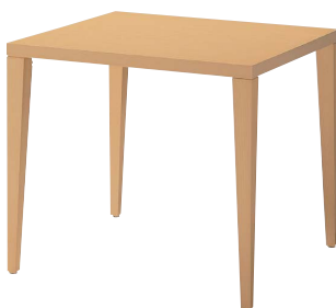
KT-721 (BR) 天板：突板/ブナ柾目 面材：突板/ブナ