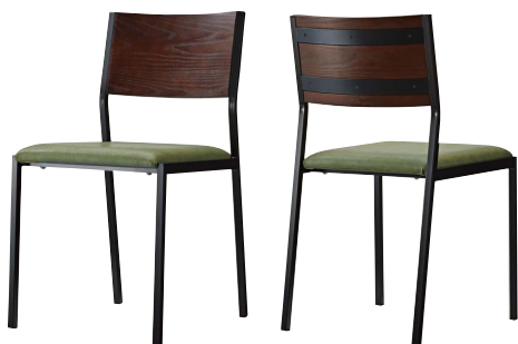
テーマイスBL2 21782-A B/レザー・パロン05