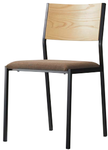
テーマイスBL1 21781-A F/布・マレンコT-9327