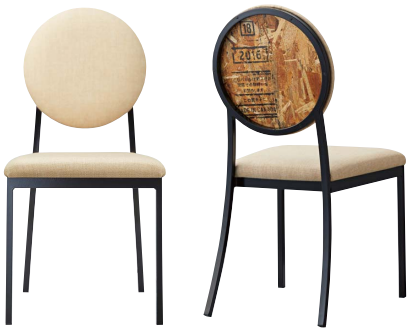
ガレイスBL 21721-A E/布・パルパ121