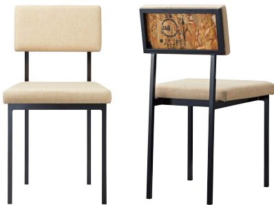
ガレイスII-BL 21722-A E/布・パルパ121