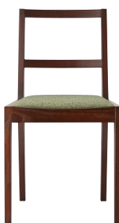
キノイスBR 11894-A E/布・カルドツイード08