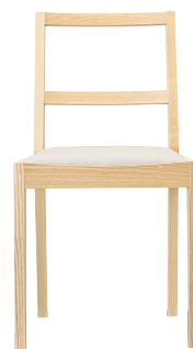
キノイスNA 11892-A D/レザー・フロワ1