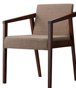
イッソウイスBR 11909-A D/布・エイガT-9204