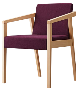
イッソウイスNA 11908-A F/布・ラット2010