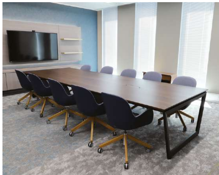
背表 : DF-441