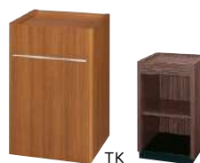
TK ■ S-TM-A277A-□・45 ¥ 100,000 W450・D450・H700