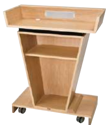
■ S-TM-3310 愛 ¥ 603,000 W900・D425・H1,050 主材：ナラ突板・ウレタン塗装 脚：ウレタンキャスター・2カ所ストップパー付