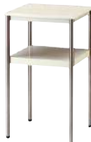
WH ■ S-OA-42B-□ ¥ 24,600 W400・D400・H700 天板：ポリエステル化粧板 脚：ステンレス丸パイプ・アジャスター付