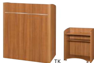
TK ■ S-TM-A277A-□・90 ¥ 193,000 W900・D475・H1,060 4輪キャスター付 天板コードホール付