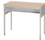
■ S-OJ-980A-D-L-B W900 記載台標準タイプ ¥ 94,000 W900・D450・H730 天板：メラミン化粧板 本体：スチール・粉体塗装