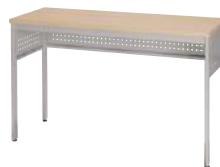
■ S-OJ-980A-D-L-A W1,200 記載台標準タイプ ¥ 110,000 W1,200・D450・H730 天板：メラミン化粧板 本体：スチール・粉体塗装