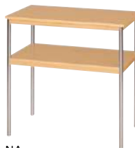
NA ■ S-OA-72B-□ ¥ 30,800 W700・D400・H700 天板：ポリエステル化粧板 脚：ステンレス丸パイプ・アジャスター付

品番の□に カラーを ご指定ください。 WH ナチュラル DK ホワイト ナチュラル ダークオーク