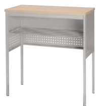
■ S-OJ-980A-D-H-B W900 記載台ハイタイプ ¥ 99,500 W900・D450・H950 天板：メラミン化粧板 本体：スチール・粉体塗装