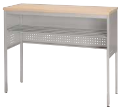
■ S-OJ-980A-D-H-A W1,200 記載台ハイタイプ ¥ 117,000 W1,200・D450・H950 天板：メラミン化粧板 本体：スチール・粉体塗装