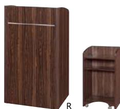
R ■ S-TM-A277A-□・60 ¥ 168,000 W600・D475・H1,060 4輪キャスター付 天板コードホール付