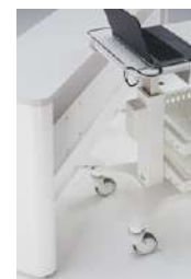
スムーズな接続をサポート する脚形状です。 ※ワイヤレスチャージ タイプのみ