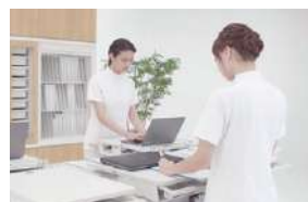
カートを接続したまま、ミーティングの場 になります。