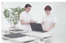
円滑な業務伝達を促すサイドテーブル。