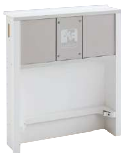
S-KJ-D002-WPT-WL-A NEW ワイヤレスチャージスタンド1口 壁埋込みタイプ W650・D150・H725