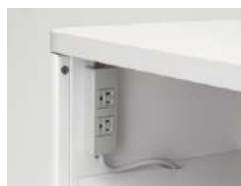
ワイヤレス充電ができない場合の非 常電源が標準装備されています。 ※定格容量を超えるおそれがある ため、非常時のみご使用ください。 ※ナーステーブルワイヤレスチャ ージタイプのみ