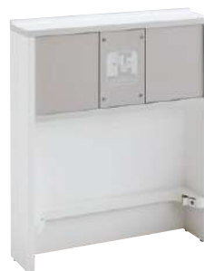
S-KJ-D002-WPT-WL-B NEW ワイヤレスチャージスタンド1口 壁付けタイプ W605・D150・H725