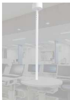
■ S-KJ-B002-CU 天井配線ユニット ¥ 34,500

※両面ナーステーブルは必ず床面に固定して ご使用ください。 ※表示価格に施工費は含まれておりません。