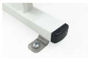
■ S-KJ-D002-T-AN 固定用アンカー 1台用セット コンセントタップ付タイプ ¥ 11,000

※両面ナーステーブルは必ず床面に固定して ご使用ください。 ※表示価格に施工費は含まれておりません。