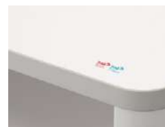
天板表面は抗ウイルス・抗菌性能 のある、清潔感に優れたメラミン化 粧板を使用。※特注仕様の場合は、 その限りではありません。都度ご確 認ください。