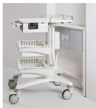
壁埋込みタイプ 設置イメージ

※建築躯体に設置場所を設けていただく必要があります。 設置方法等についてはお問い合わせください。 躯体への固定が必要です。