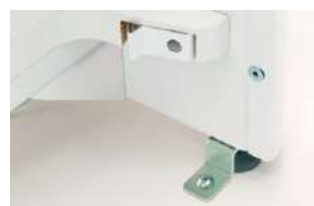
■ S-KJ-D002-WPT-AN 固定用アンカー 1台用セット ワイヤレスチャージタイプ ¥ 11,000

※両面ナーステーブルは必ず床面に固定して ご使用ください。 ※表示価格に施工費は含まれておりません。