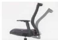
ロック機能 背のロックが可能です。