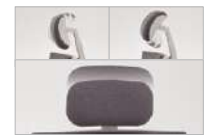
ヘッドレスト調節機能 ヘッドレストの高さ・角度の調節が可能です。