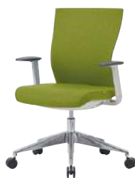
● S・CN-74-L-AC-GE 品 ¥ 86,200 フレーム：ナイロン(ホワイト) 脚：アルミダイキャスト・φ60ナイロンキャスター