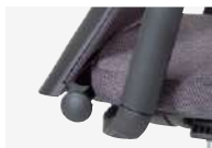
ロック反力調整 レバーを前後に回すことでロック反力の強弱を調整できます。