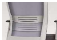
ランバーサポート機能 お好みの位置に調節できる、ランバーサポート付きです。