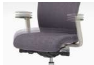
昇降機能 座・肘の昇降が可能です。