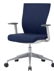
● S・CN-74-L-AC-SO 品 A ¥ 102,000 B ¥ 104,000 C ¥ 106,000 D ¥ 108,000 E ¥ 110,000 F ¥ 112,000

フレーム：ナイロン(ホワイト) 脚：アルミダイキャスト・φ60ナイロンキャスター