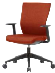
● S・CN-73-L-AC-OR 品 ¥ 78,500 フレーム：ナイロン(ブラック) 脚：ナイロン・φ60ナイロンキャスター