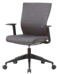
● S・CN-73-L-AC-GY 品 ¥ 78,500