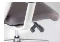
ロック反力調整 レバーを前後に回すことでロック反力の強弱を調整できます。