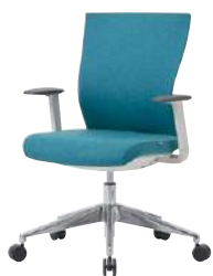
● S・CN-74-L-AC-BU 品 ¥ 86,200