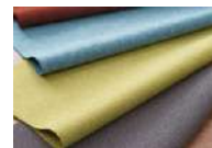
こだわりのファブリック 発色の美しいデンマーク製のファブリックを使用しています。