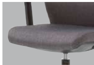
モールドウレタン座 座面には、長時間座っていても疲れにくいモールドウレタンを使用しています。