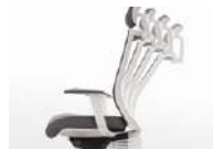
シンクロック機能 3段階で固定可能なシンクロック機能です。