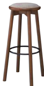
BR2 ¥36,500 張材：平織[CF-20C]