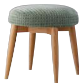
NO ¥32,000 張材：平織[ランク外(UP180)]