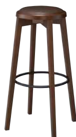
BR2 ¥36,200 張材：ビニールレザー[BL-08G]