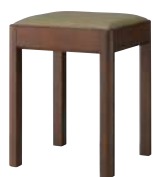
BR2 ¥22,800 張材：ビニールレザー[CL-35N]