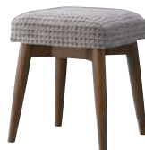
MO ¥32,000 張材：平織[ランク外(UP181)]