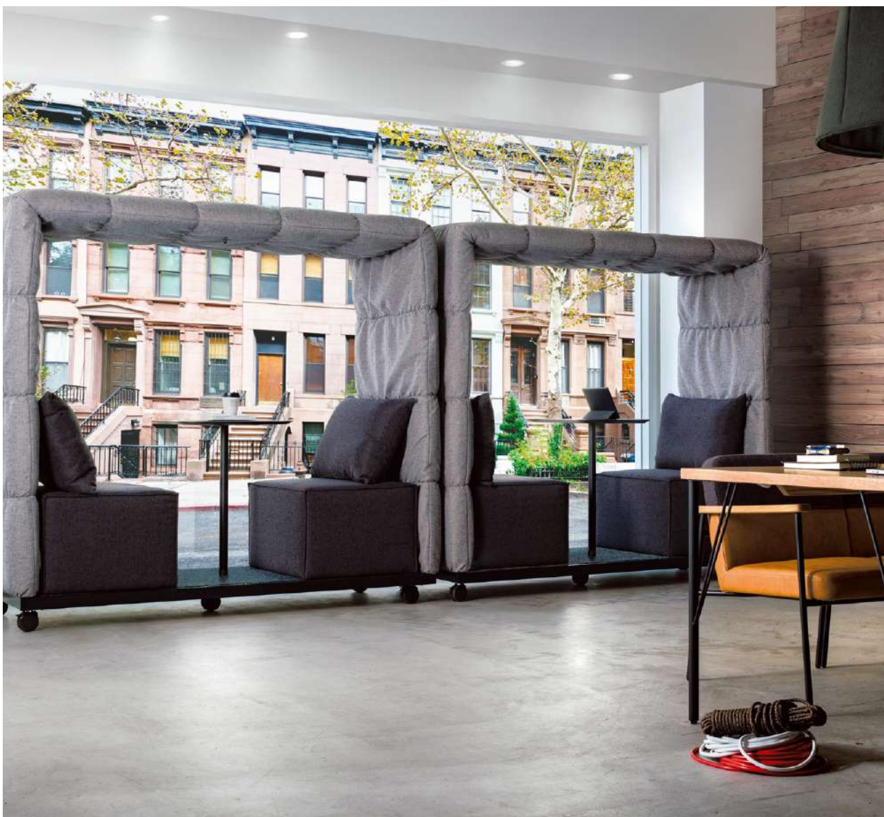
※写真は参考張地です。