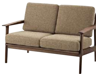
LC ¥ 290,000 張材：平織【EF-20H】