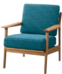
AC ¥ 205,000 張材：平織【EF-20J】