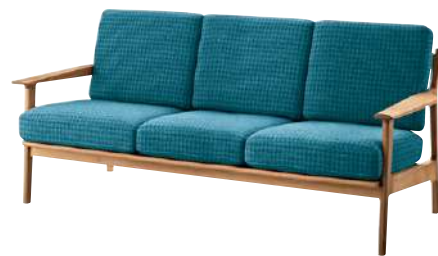
SF ¥ 391,000 張材：平織【EF-20J】