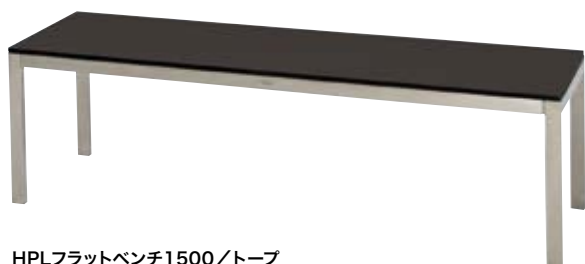
HPLフラットベンチ1500/トープ HPL Flat Bench 1500/Taupe