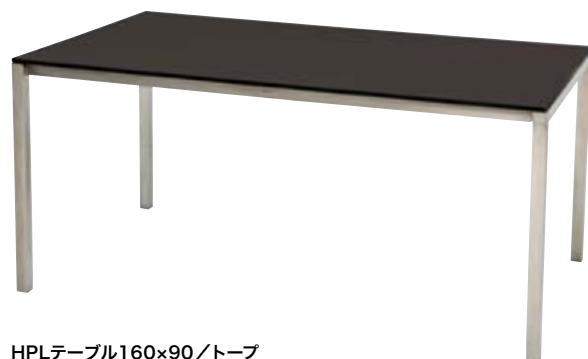
HPLテーブル160×90/トープ HPL Table 160×90/Taupe