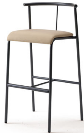
ハイチェア(肘なし) S491-74GM