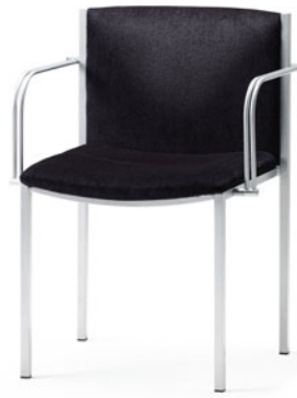
アームチェア(肘付) S401-41MS