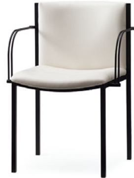
アームチェア(肘付) S401-41RB