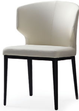
アームチェア(肘一体型) S1030-11BW