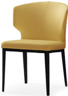
アームチェア(肘一体型) S1030-11BY