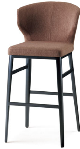
ハイチェア(肘一体型) S1030-74GM