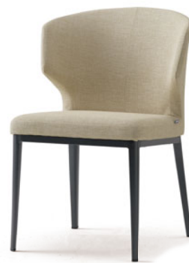
アームチェア(肘一体型) S1030-11GM