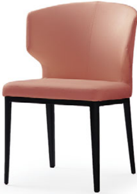
アームチェア(肘一体型) S1030-11BP