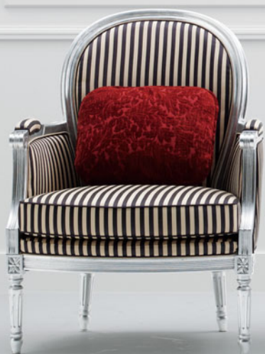
張材: B36-02 (ブラック) 布 背クッション / C13-03 (レッド) 布