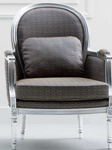
張材: B37-01 (グリーン) 布 背クッション / B37-01 (グリーン) 布