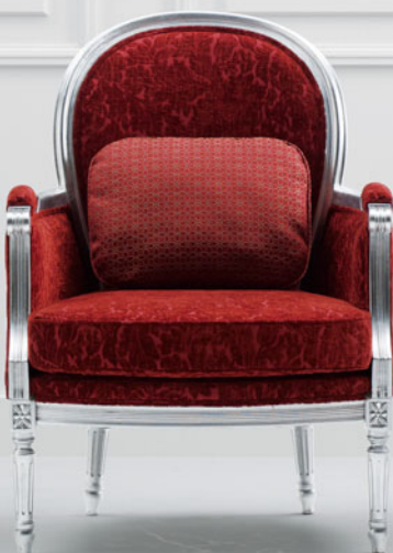
張材: C13-03 (レッド) 布 背クッション / B37-03 (レッド) 布