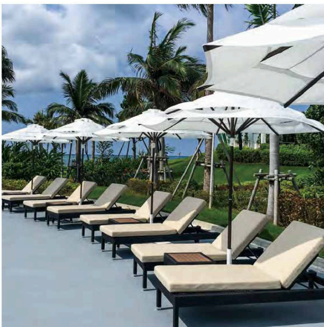
M.U. : SY-2500 ブラウンフレーム 耐風タイプ

木目調フレーム(転写プリント) 焼き付け塗装後、木目模様のフィルムを熱転写し、 本物の木と見間違えに仕上げてあります。