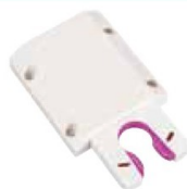
● ST-WT (ホワイト)