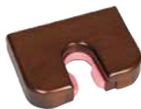
壁用 ● SJ22 (ローズ)