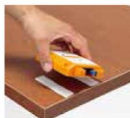
面ファスナーで取付け