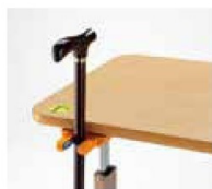
テーブルなどに取付けで使用します。

2019年4月、杖ホルダーの安全性や使いやすさ、適切な設置方法などについて示したJIS (日本産業規格)「JIS T 9289 高齢者・障害者配慮設計指針—ステッキホルダーの保持部」が発行されました。本製品はこの規格に準拠して作られております。