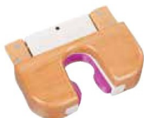
椅子、テーブル、手摺り用 ● SJ21 (ナチュラル)