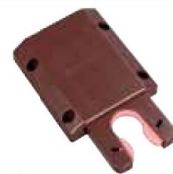
● ST-BR (ブラウン)