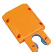
● ST-OR (オレンジ)