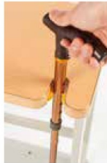
※写真の杖は別売りです。