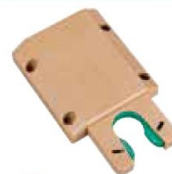
● ST-VJ (ベージュ)