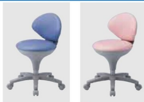
● WS021-VBL (ブルー)