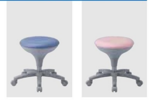
● WS020-VBL (ブルー)