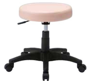
● GS010-VPI (ピンク)