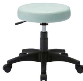
● GS010-VBL (ブルー)