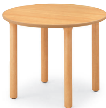
T25 MN-900φ - MB 8N ¥76,200 700H 脚部: ¥36,000 天板: ¥40,200 > P317 表面材: メラミン化粧板 縁材: 塩ビソフトエッジ