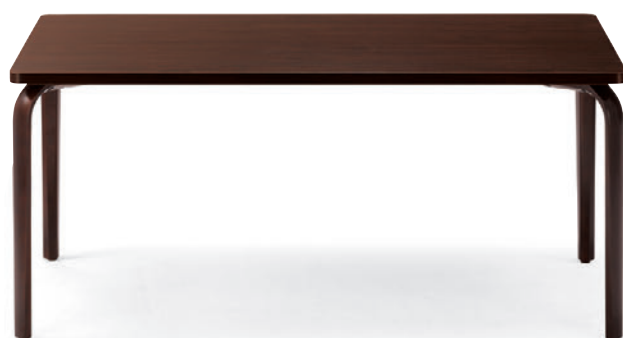
T20 M9-1600W 900D - ML 1N ¥102,100 700H 脚部: ¥42,000 天板: ¥54,500 > P313 表面材: メラミン化粧板 縁材: ABS樹脂 ○反り止め金具付