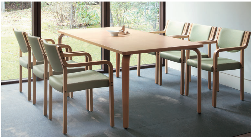
▲T20 M2-1800W 900D - ML 5N ¥107,100 700H ○反り止め金具付 チェア:リスカB 5NL (P136)