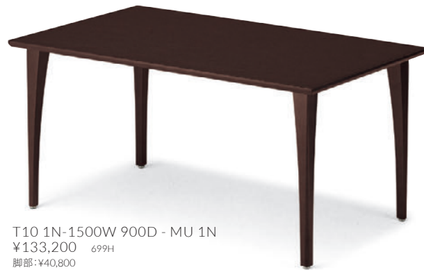
T10 1N-1500W 900D - MU 1N ¥133,200 699H 脚部：¥40,800 天板：¥86,800 > P321 表面材・オーク突板(柾目) 縁材・オーク無垢材 ○反り止め金具付