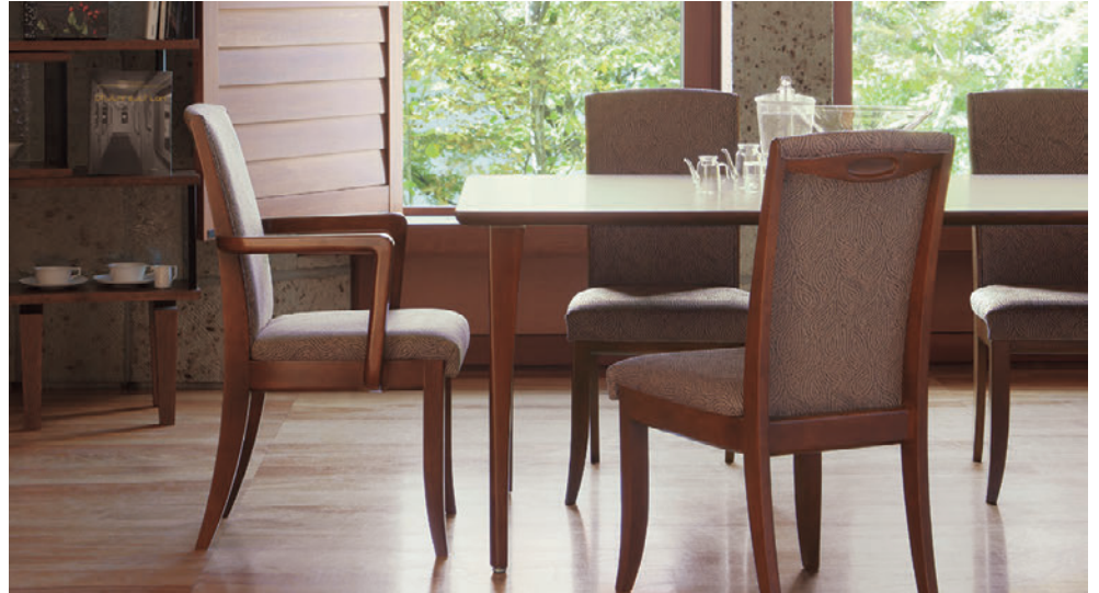
▲T10 3N-1800W 900D - MU 3N ¥195,600 699H ○反り止めパーツ付 チェア：プロテアM、W 3N (P93)