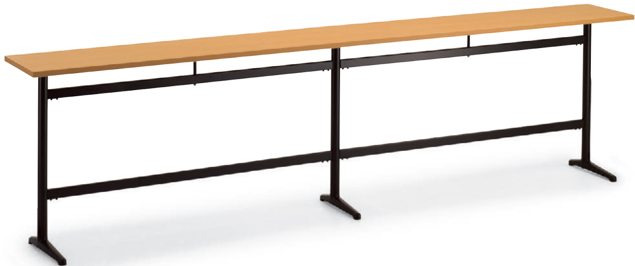
TB2804 - IFH-BL ¥155,800