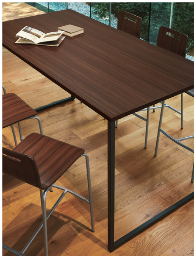
▲TB2922-LEH-DG ¥150,700 1800W 750D 998H ○反り止めパーツ付 チェア: キーノカウンター 1 SI-MX (P232)