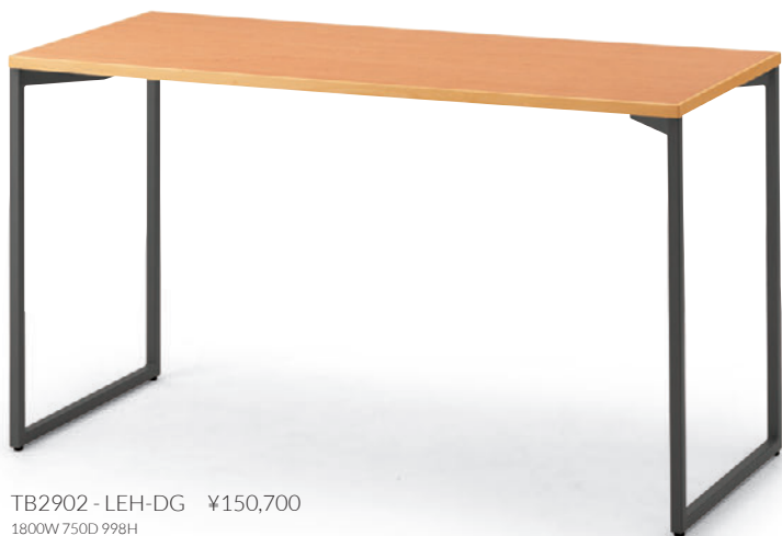
TB2902-LEH-DG ¥150,700 1800W 750D 998H 脚部: ¥44,000 天板: ¥89,500 ≧ P341 表面材: メラミン化粧板 縁材: プナ無垢材 ○反り止めパーツ付