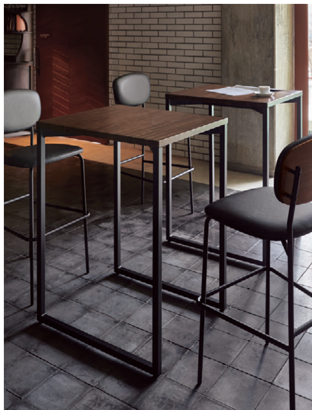
▲TB3079-LEH-DG ¥65,500 600W 750D 1000H チェア: ルベカウンター DG-MX (P231)