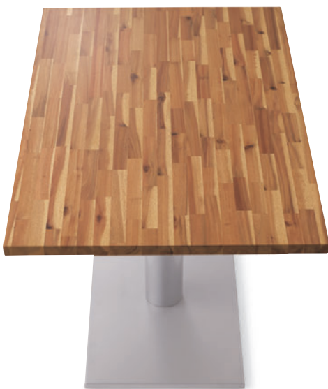
TB3068 - EV1-SI ¥78,900 1200W 750D 700H / 脚750×450 天板:¥45,200 脚部:¥33,700 >> P372 スチール角脚 (粉体塗装・シルバー)