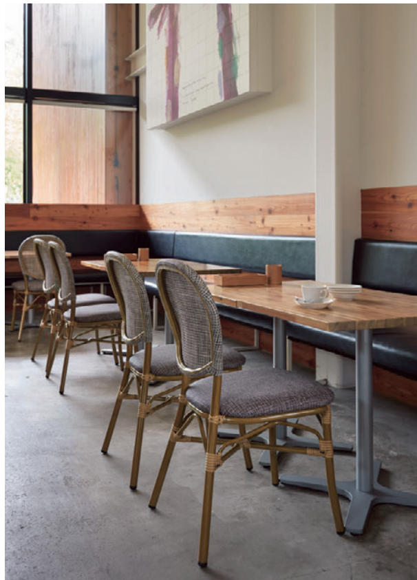
▲TB3069 - GV-SI ¥48,000 600W 750D 700H / 脚640L チェア:アラニ2 NA (P197)