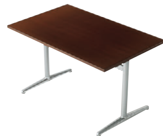
T09 1N-1200W 750D - IF-PO ¥85,300 695H/脚650L 天板:¥53,600 脚部:¥31,700 >> P378