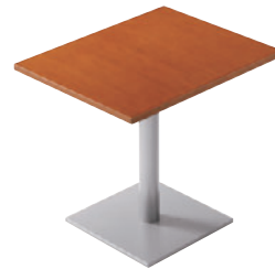
T09 9N-600W 750D - EV-SI ¥52,600 695H/脚450 □ 天板:¥28,500 脚部:¥24,100 >> P372