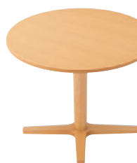
T09 5N-900 φ - GAW-5N ¥117,600 695H/脚750L 天板:¥71,400 脚部:¥46,200 >> P383