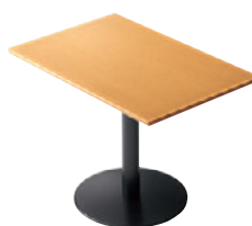
T10 NA-900W 600D - SV-BL ¥66,100 649H/脚500φ 天板:¥38,800 脚部:¥27,300 >> P371