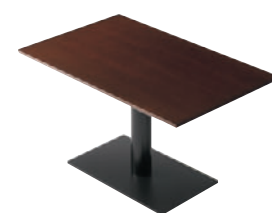
T10 11N-1200W 750D - EV1-BL ¥96,600 699H/脚750×450 天板:¥62,900 脚部:¥33,700 >> P372