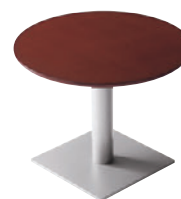
T10 2N-900 φ - EV-SI ¥88,900 699H/脚550 □ 天板:¥58,200 脚部:¥30,700 >> P372