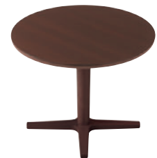
T22 1N-900 φ - GAW-1N ¥102,000 698H/脚750L 天板:¥55,800 脚部:¥46,200 >> P383