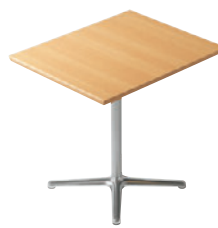
T22 5N-600W 750D - GF-PO ¥52,300 698H/脚650L 天板:¥31,000 脚部:¥21,300 >> P375