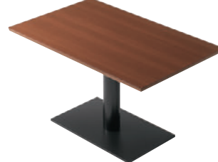
T22 3N-1200W 750D - EV1-BL ¥83,800 698H/脚750×450 天板:¥50,100 脚部:¥33,700 >> P372