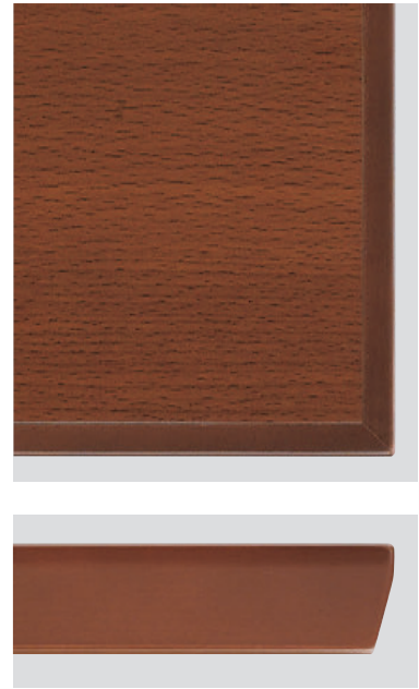
▲T22 5N-900W900D-GF-BL ¥72,000 698H/脚900L チェア:コトル DG-6T (P155)