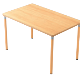
T25 MN-1200W 750D - MD-NA ¥80,700 720H 天板: ¥55,200 脚部: ¥25,500