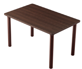
T25 MD-1200W 750D - MB-1N ¥91,200 700H 天板: ¥55,200 脚部: ¥36,000