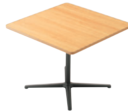
T25 MN-900W 900D - GF-BL ¥72,100 700H / 脚900L 天板: ¥44,400 脚部: ¥27,700