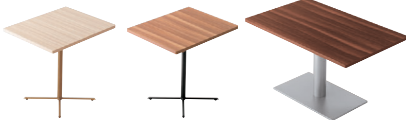
T31 ML-600W 750D - GM-GL ¥50,600 729H/脚650L 天板:¥33,800 脚部:¥16,800