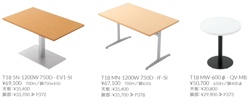
T18 5N-1200W 750D - EV1-SI ¥69,100 700H/脚750×450 天板:¥35,400 脚部:¥33,700 ≧ P372