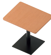
セット例 ¥40,500 T20 M4-600W750D -EV-BL 450