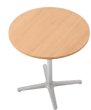
セット例 ¥52,600 T20 M2-750φ -GF-SI 650L

脚カラー:限定脚は2色(SI・BL)からお選びください。 脚詳細はEV:P372、GF/XF:P375、IF:P378をご覧ください。