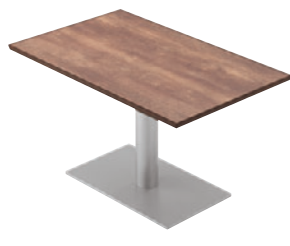
FT1-A25 1200W 750D - EV1-SI ¥112,600 698H/脚750x450 天板:¥78,900 脚部:¥33,700