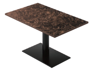
FT2-A17 1200W 750D - EV1-BL ¥72,300 700H/脚750x450 天板:¥38,600 脚部:¥33,700