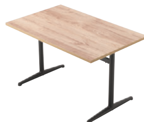
FT2-C01 1200W 750D - IF-BL ¥89,700 700H/脚650L 天板:¥58,000 脚部:¥31,700