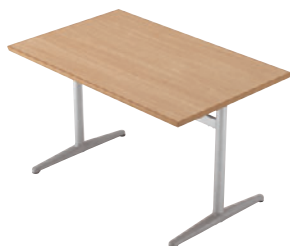
FT1-A05 1200W 750D - IF-SI ¥110,600 698H/脚650L 天板:¥78,900 脚部:¥31,700