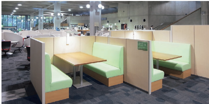
▲バンE1OM-2-NA バンE1OM-5-NA 張材:レザー・B-15 (No.25)