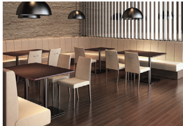
(写真左) バンA1 OM-4 (W1300 H750) -NA 張材:レザー・B-15 (No.9、26) テーブル: T14 MN-600W 750D - SS-SI (P318) T14 MN-600φ - SS-SI (P318) チェア:ラゲットA1 WH (P163)