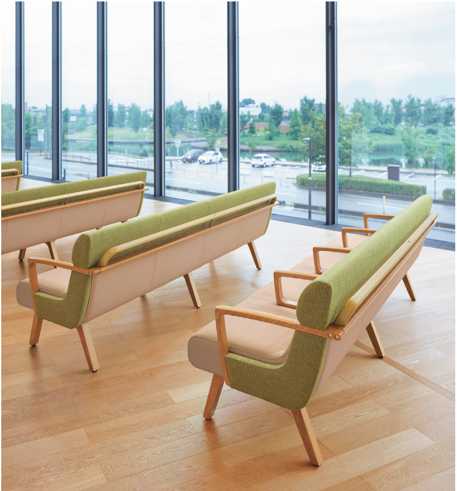
▲コルナスLYH 5N-A (手すり付) ¥455,300 張材:布地・C-41 (ライトグリーン) ×レザー・C-12 (No.3)