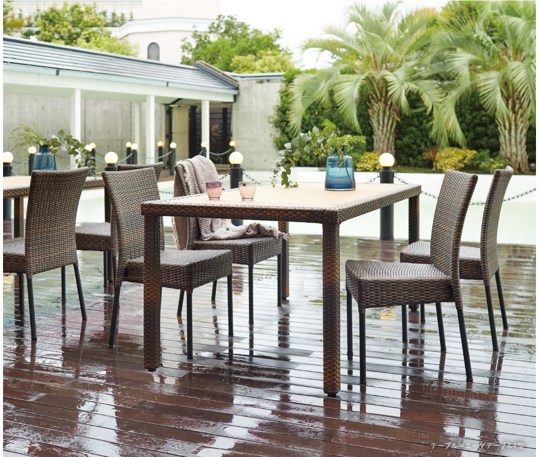
テーブル・エーゲテーブル4型