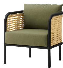
M 張地: サンブレラ・18011-0000(GB) ¥175,800

屋外対応張地はP273からお選びください。 ＊背と座の2色張りににつきましては、別途お見積もりとさせていただきます。