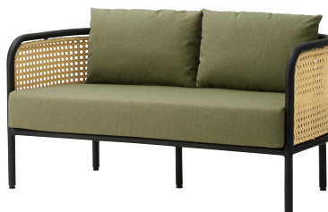
L 張地: サンブレラ・18011-0000(GB) ¥288,300