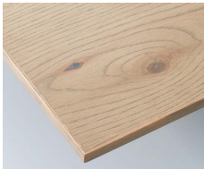
アンティークグレー