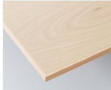
アンティークナチュラル