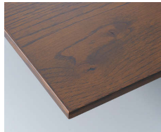
アンティークブラウン

※突板の目や色を最大限に活かす仕上げの為、同じ塗装色でも仕上がりに差が生じます。 又、突板には節が混じる場合も有ります。予めご了承下さい。