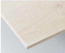
アンティークホワイト