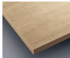
B ナチュラル(CTB-18) (メラミン化粧板:TJY-459K)