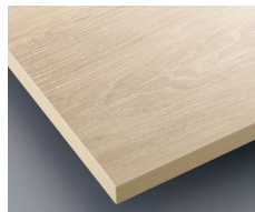
A ホワイト(CTB-17) (メラミン化粧板:JC-682K)

天板: フラッシュ構造・メラミン化粧板(エンボス) オーク木目柄・ABS樹脂エッジ(キブラス)・T=30mm 脚部: スチール・黒塗装・アジャスター付(組立式) 150: W1500×D900×H1000mm ¥182,000 180: W1800×D900×H1000mm ¥186,000