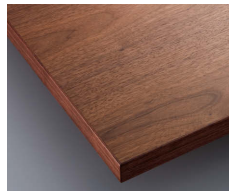
A ウォールナット突板(CTA-02)

天板: ウォールナット突板(板目・柎目ランダム)・ 木縁巻き(ウォールナット材)・T=30mm 脚部: スチール・黒塗装・アジャスター付(組立式) 150: W1500×D900×H1000mm ¥241,000 180: W1800×D900×H1000mm ¥265,000