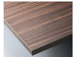
D ダークブラウン(CTB-20) 変更有 (メラミン化粧板:TJ-10005K)