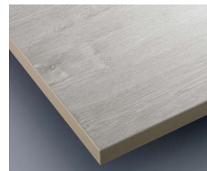
C グレー(CTB-19) (メラミン化粧板:JC-512K)