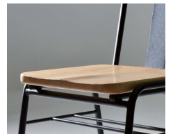
座板は座割り加工されています。