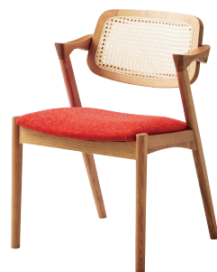
ナチュラル 張地: 布・クオーレ#CU01 (A) ¥34,000