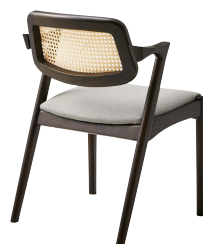
ブラックウォッシュ 張地: レザー・オクタビア・L-6255 (B) ¥34,800