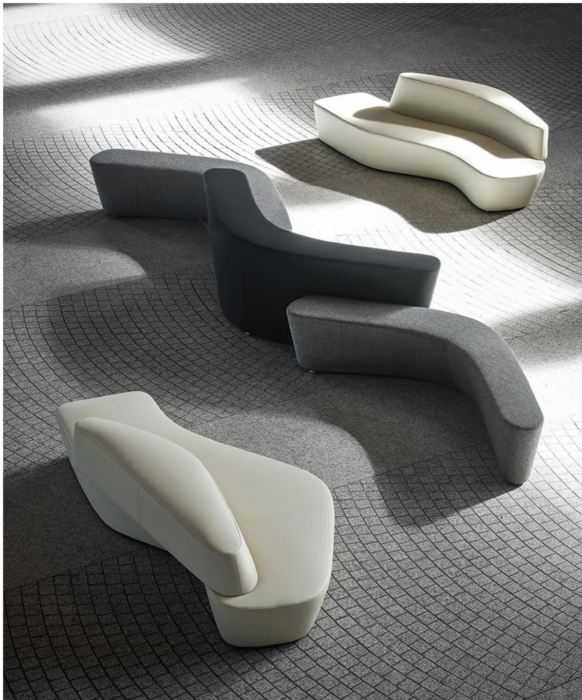
上から、MUS0132IV、MUS0133IV 中央にある3台のベンチタイプのシリーズは、P.211に掲載しています。