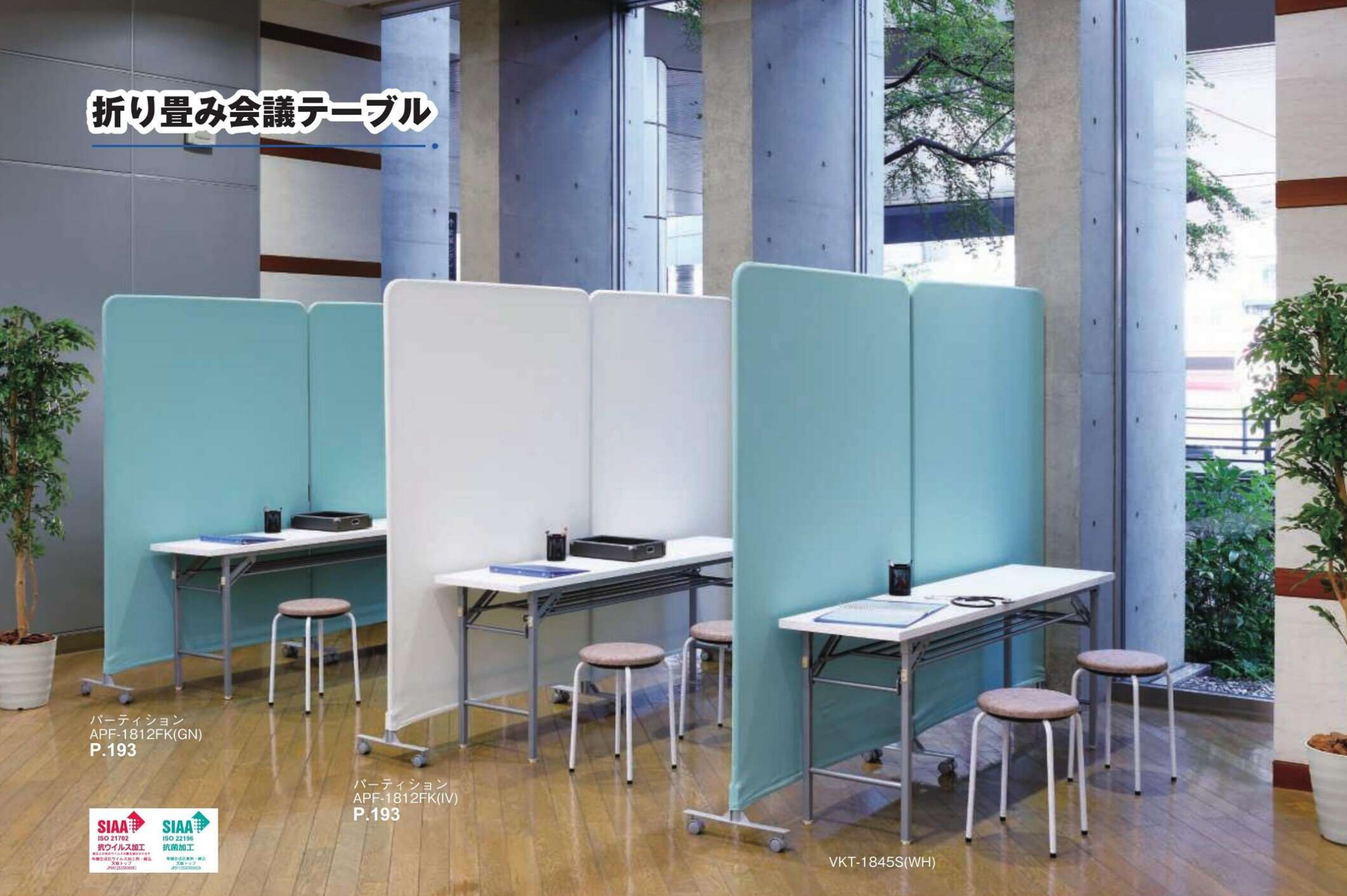
パーティション APF-1812FK(GN) P.193