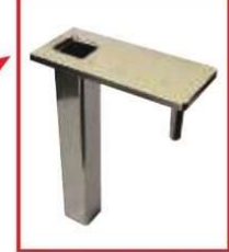
エンドストッパー単体