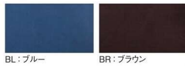
BL: ブルー BR: ブラウン