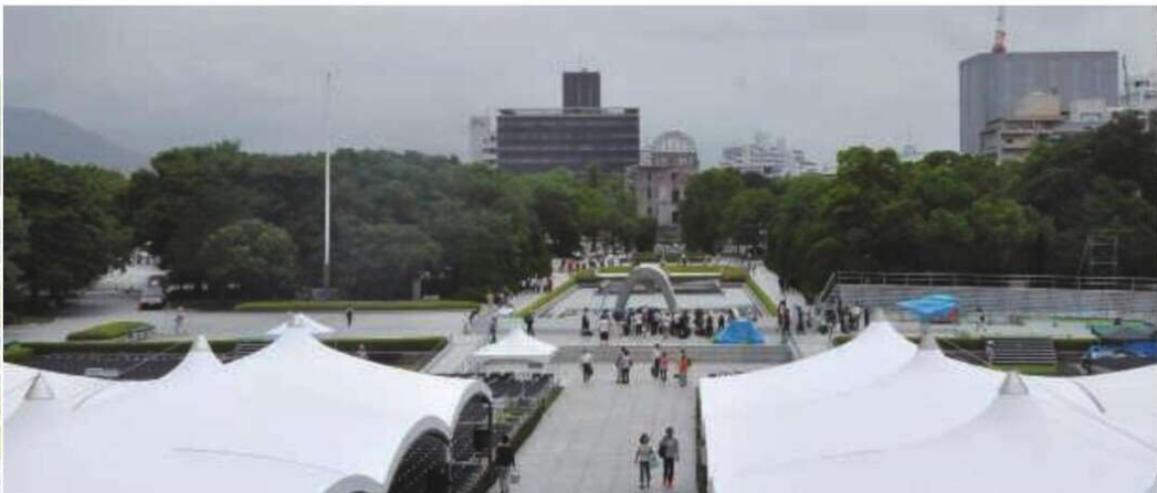
平和記念式典(広島市) 2014年8月納入