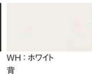
WH: ホワイト 背 座