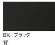
BK: ブラック 背 座