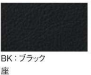
BK: ブラック 背 座