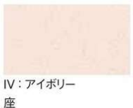
IV: アイボリー 背 座