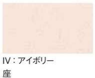
IV: アイボリー 背 座