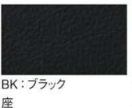
BK: ブラック 背 座