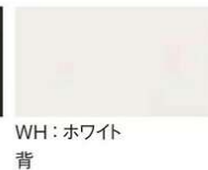
WH: ホワイト 背 座