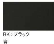
BK: ブラック 背 座