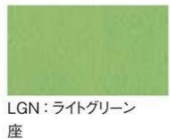
LGN: ライトグリーン 背 座