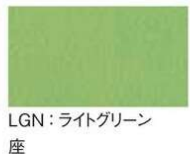
LGN: ライトグリーン 背 座