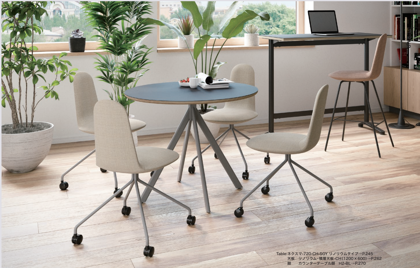
Table:ネクスマ-720-CH-SGY リノリウムタイプ→P.245 天板-リノリウム・横履天板-CH(1200×600)→P.262 脚-カウンターテーブル脚 H2-BL→P.270