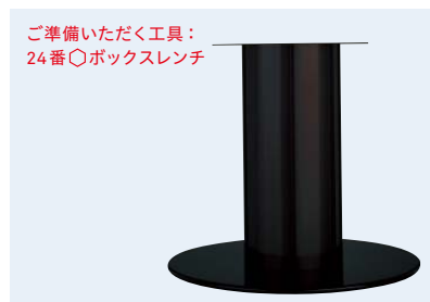
TABLE LEG 丸ベース