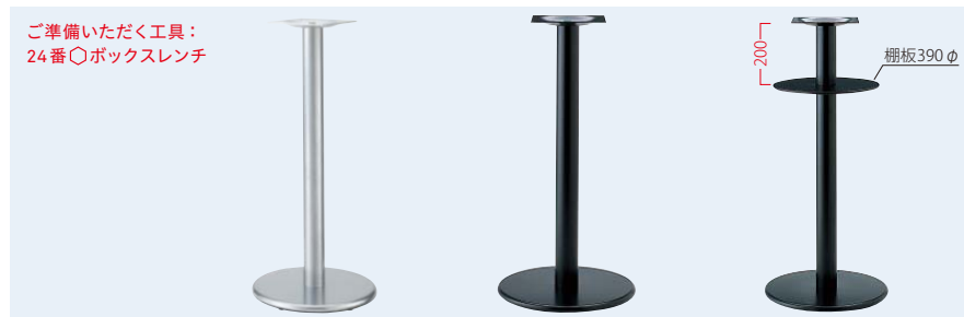
TABLE LEG ハイテーブル用